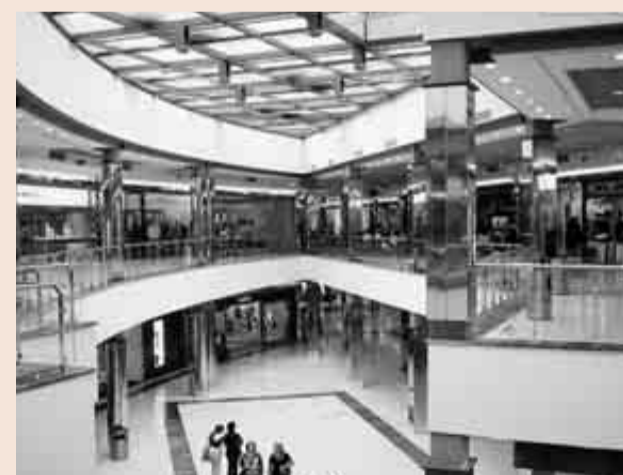
L'Ànec Blau, en Castelldefels (Baix Llobregat) es uno de los centros comerciales donde trabajó Ibinser.

El concurso voluntario de acreedores -con un pasivo de 1,4 millones- fue presentado el pasado 15 de marzo por la sociedad Ingeniería de Serveis, Ibinser de Ingeniería y Management Building & Project. El administrador concursal es Ferran Zaragoza, socio de TMZ Abogados.