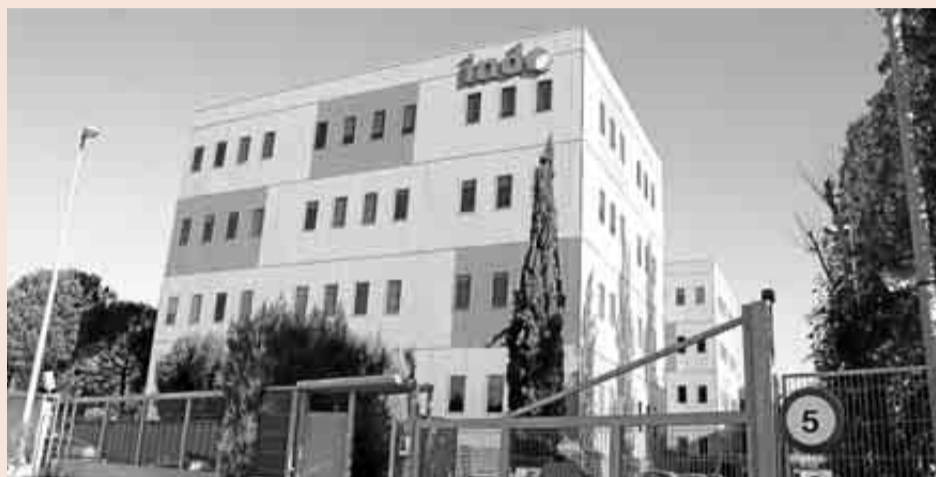
Sherpa, Nazca y PHI señalan que están dispuestos a mantener las oficinas de Sant Cugat del Vallès.